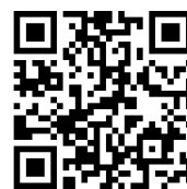
受付専用フォーム