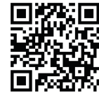
受付専用 QR コード