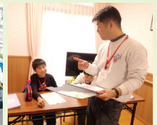
自己理解と自己肯定感