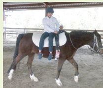
状況把握や客観性