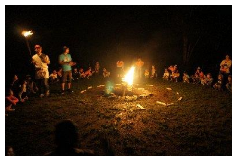
夜はキャンプファイヤー