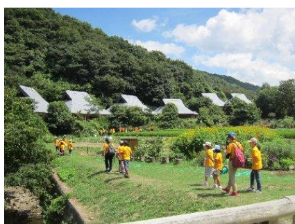
みんなで古民家に泊まろう！