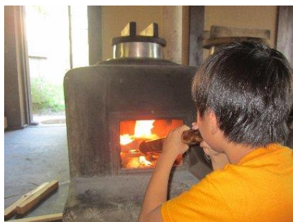
みんなで協力してご飯をたくぞ！